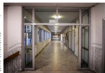
Kameror sätts upp i den första högstadietklassens korridor, med omkring 600 elever.