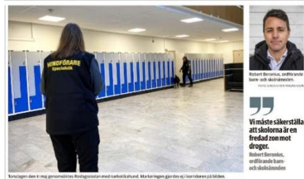
Förstaden där en narkotikahundar Roslagsskolan med narkotikahund. Märken gör det i korridor på bilden.